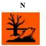
Peligroso para el Medio ambiente